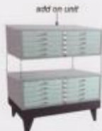
L22 Lemari gambar dengan base dan kaki. Drawing cabinet with base and legs.

Ukuran / Dimension 1,375(W) x 990(D) x 600(H) mm