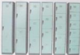
L.551 L.552 L.553 L.554 L.555 L.556

Ukuran / Dimension 380(W) x 380(D) x 1,830(H) mm