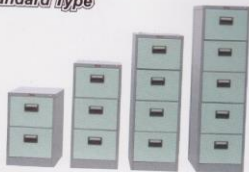
L.42 L.43 L.44 L.45