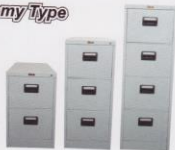
L. 42E L. 43E L. 44E